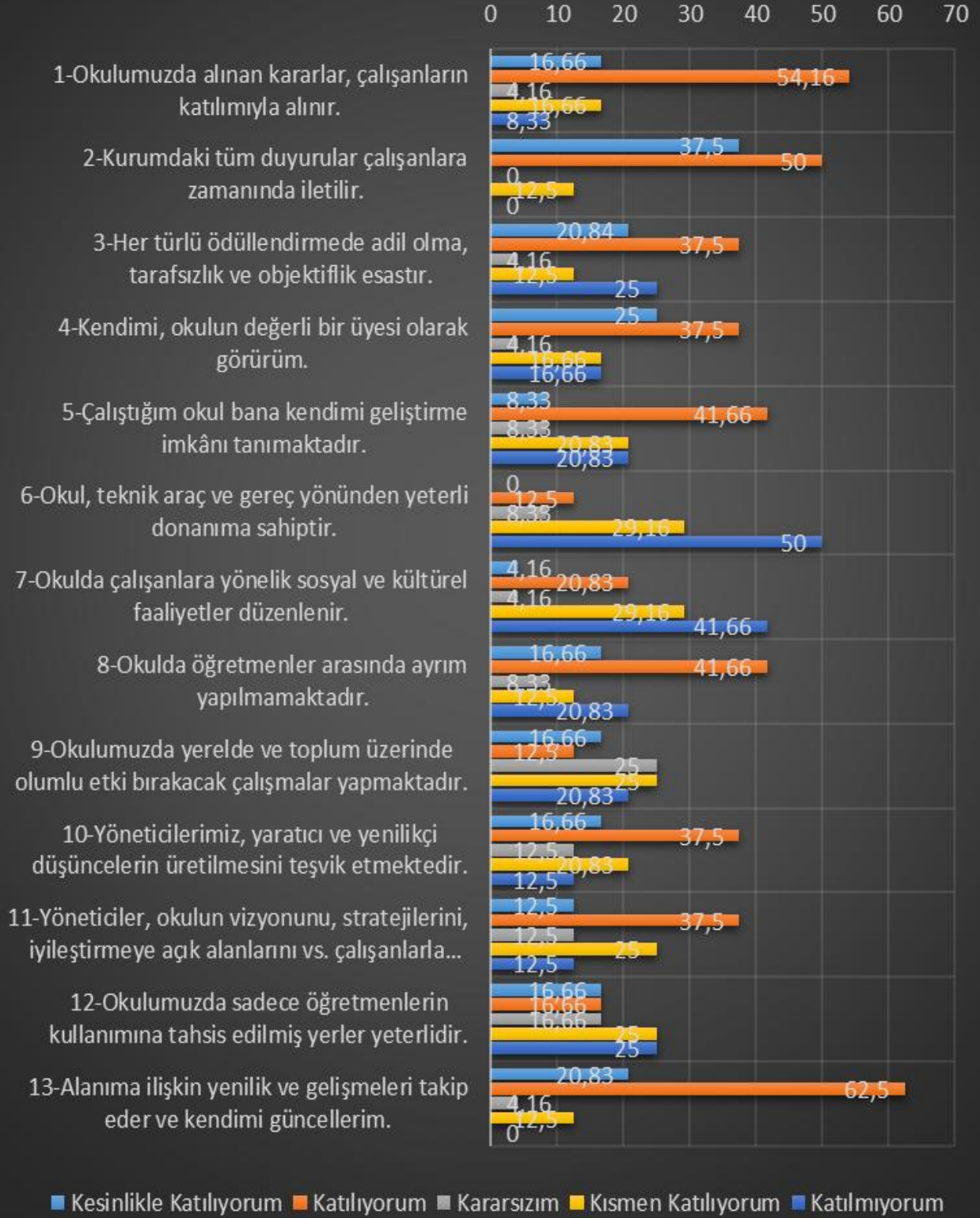
Şekil 2: Katılımcı Karar Alma Seviyesi